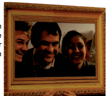
Lauréats 2009, ils sont partis avec Imaginove à l'Expo Universelle de Shanghai cette année!